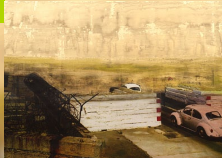
Grenzerfahrungen: Heinrich-Heine-Straße II, Mixed Media auf Print von Thomas Kälberloh 2021