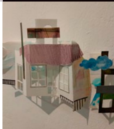
unten: Heine-Haus, Ausschnitt aus einer größeren Arbeit