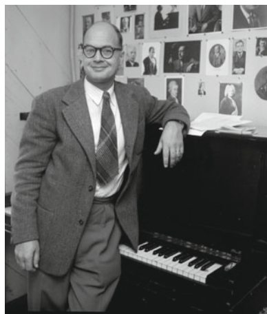
Ingolf Dahl (1955)