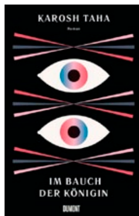
Buch-Cover „Im Bauch der Königin“

2018 veröffentlichte sie ihren ersten Roman ‚Beschreibung einer Krabbenwanderung‘ bei DuMont. Ihr aktueller Roman ‚Im Bauch der Königin‘, aus dem sie am 22. August in der Villa im Heine-Park las, erzählt die Geschichte jugendlicher kurdischer Einwanderer aus zwei Perspektiven, einer weiblichen und einer männlichen. Es ist formal als sogenanntes ‚Wendebuch‘ gestaltet, also von zwei Seiten zu lesen und erzählt ‚hypnotisch-märchenhaft‘ (DEUTSCHLANDFUNK) von ihren Befindlichkeiten und gesellschaftlichen Erwartungen.