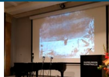
William Kentridges Animationsfilm „Monument“ aus dem Jahr 1990