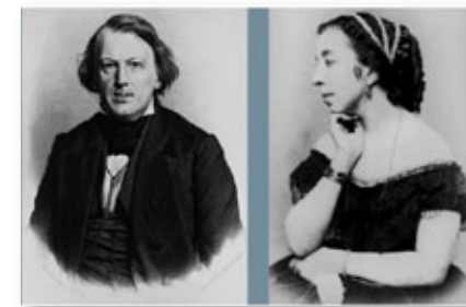
Julius Rietz und Pauline Viardot Garcia