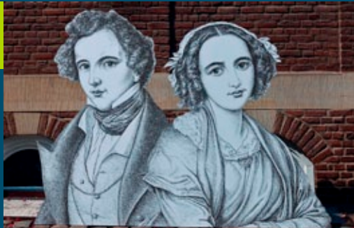
Felix und Fanny Mendelssohn Collage nach Zeichnungen von Eduard Bendemann und Wilhelm Hensel