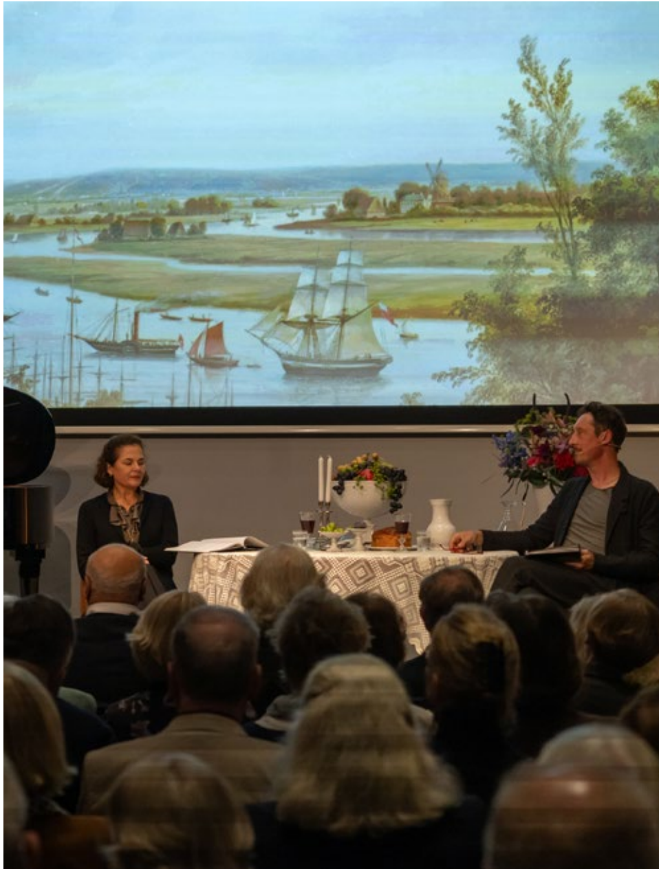
Barbara Auer am Tisch mit Hans Löw